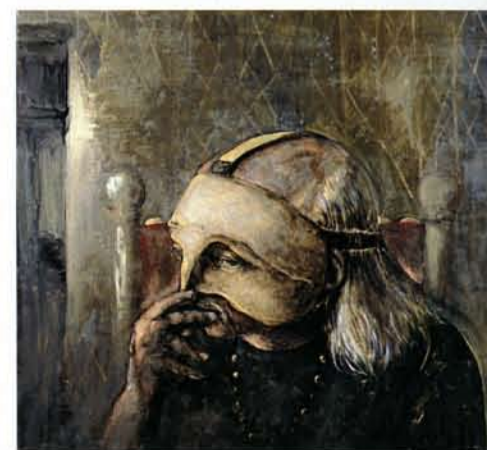
In Atlantide praeco, Autoritratto con la maschera, 1981

Caratteristiche editoriali edizione bilingue (italiano-inglese), 3 tomi 24 x 28 cm, 1704 pagine, 280 colori e 3700 b/n cartonato con cofanetto, ISBN 978-88-6130-171-9 Prezzo speciale di prenotazione con coupon € 350,00 anziché € 450,00 (spese di spedizione escluse: vedi tabella) valido fino al 31 marzo 2012