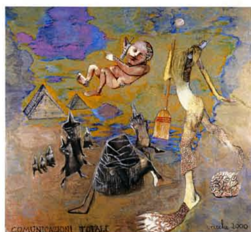
Comunicazioni totali, 2000