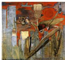
Comunicazione urgente di Margherita al suo maestro, 2000

Caratteristiche editoriali edizione bilingue (italiano-inglese), 3 tomi 24 x 28 cm, 1704 pagine, 280 colori e 3700 b/n cartonato con cofanetto, ISBN 978-88-6130-171-9 Prezzo speciale di prenotazione con coupon € 350,00 anziché € 450,00 (spese di spedizione escluse: vedi tabella) valido fino al 31 marzo 2012